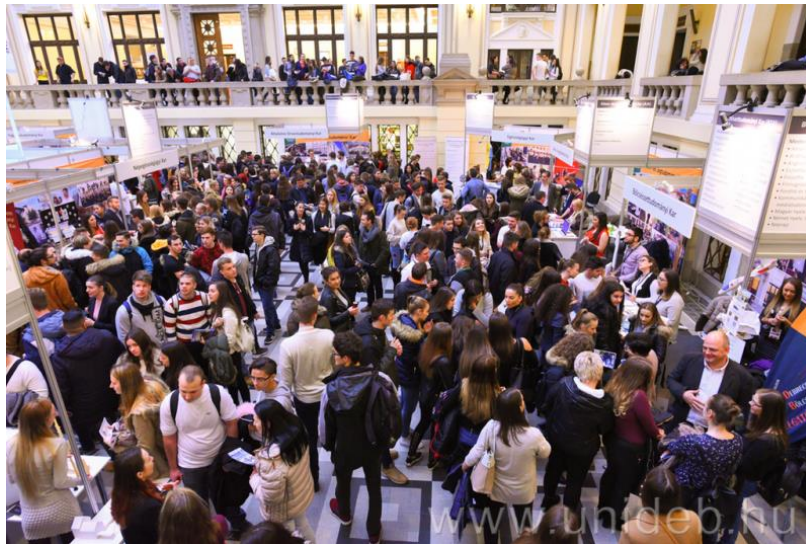
DEXPO aan de Universiteit Debrecen

Ook de universiteit organiseert open dagen voor middelbare scholieren , de zogenaamde DEXPO, waar scholieren gedurende twee dagen een kijkje kunnen nemen in het leven van alle 14 faculteiten van de Universiteit Debrecen. Er worden info-uurtjes gegeven, colleges mogen worden bezocht, er is gelegenheid met studenten en docenten te praten over de opleiding, de beroepsmogelijkheden en andere kwesties.