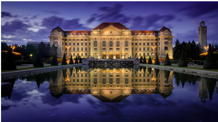
Hoofdgebouw van de Universiteit Debrecen

Deze activiteit van de Vakgroep Nederlands had succes. Het aantal studenten neerlandistiek bleef, vergeleken met andere kleine vakgroepen van onze faculteit, constant hoger en dat viel ook de leiding van de faculteit op. Het aantal studenten neerlandistiek aan de faculteit was en is nog steeds hoger dan het aantal van studenten Frans en Italiaans samen.