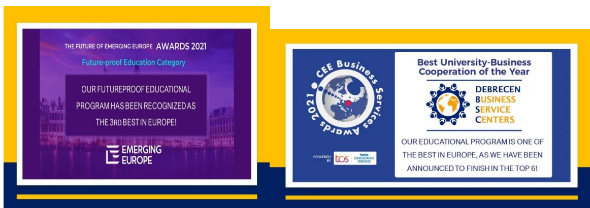
Prijzen en nominaties van BSC Roundtabel Debrecen

We zijn ook heel trots op ons eerste rondetafelgesprek. In 2016 lieten we alle vertegenwoordigers van multinationals van de branche Shared/Business Service Centres (SSC/BSC) in Debrecen aan tafel zitten om een nog intensievere samenwerking tussen het bedrijfsleven en de universitaire wereld te bevorderen. Uit dit eerste gesprek is een uniek en ondertussen nationaal en internationaal erkend bedrijfsverband ontstaan (Debrecen BSC Roundtabel, www.bscdebrecen.com ), waarin op dit moment negen bedrijven vertegenwoordigd zijn (4iG, BT, Deutsche Telekom IT Solutions, Diehl Aviation Hungary Kft., Epm Systems Inc., Flowserve Hungary Service Kft., NI Hungary Kft., Transcosmos Kft., United Call Centers Kft.). In 2021 tekende BSC Roundtabel een officieel samenwerkingscontract met de Universiteit Debrecen.