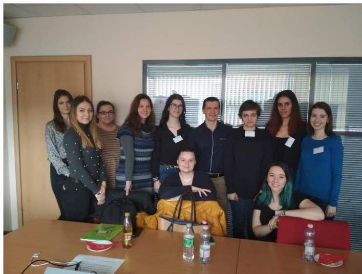
Foto 5: Bureaubezoek bij BT (British Telecom) op 27 februari 2020

Hoewel het uitvoeren van presentaties aan de universiteit en bedrijfsbezoeken bij de partners in de afgelopen twee jaar door COVID-19 steeds moeilijker werden, reageerden we reeds in het begin van de pandemie snel op de veranderde omstandigheden en gingen met onze zakelijke evenementen gewoon in online-vorm door.